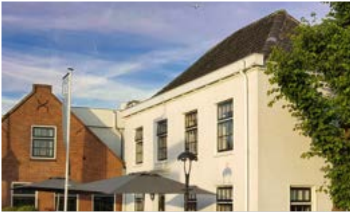
Het Blesse Paard