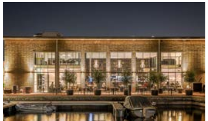
PuuRR aan de Binck

www.paviljoenockenburgh.nl ● 070 - 325 89 04