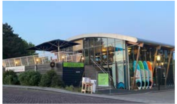
PuuRR aan de Vliet

www.puurraandevliet.nl ● 070 - 320 01 80