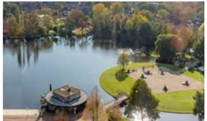
PuuRR aan de Dobbe

www.restaurantleeuwenbergh.nl ● 070 - 319 33 40