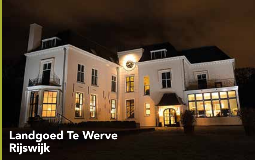
Landgoed Te Werve Rijswijk