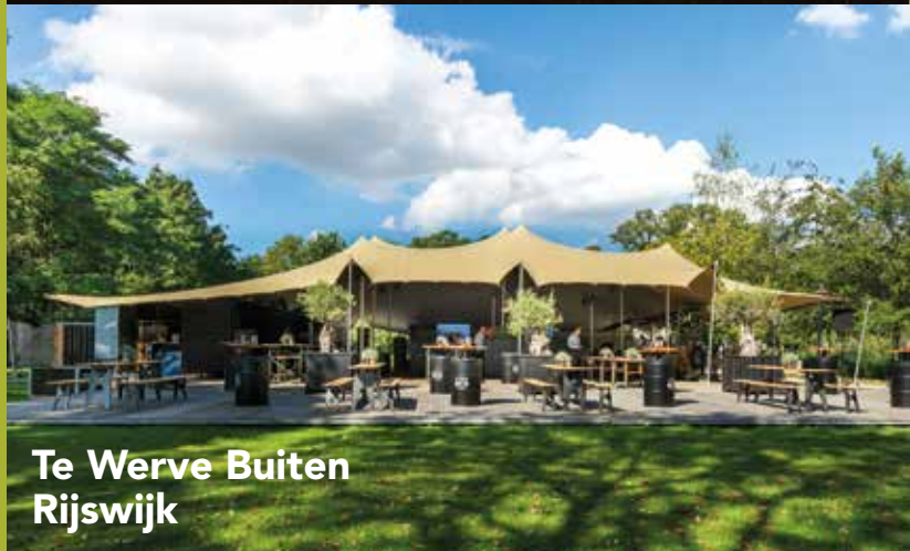
Te Werve Buiten Rijswijk