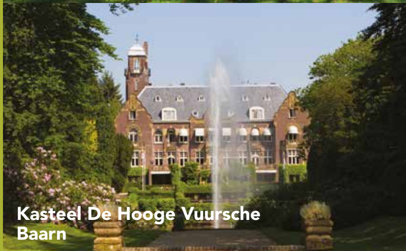
Kasteel De Hooge Vuursche Baarn