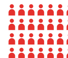
Receptie | Feest